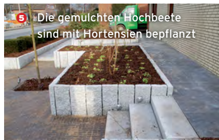
5 Die gemulchten Hochbeete sind mit Hortensien bepflanzt