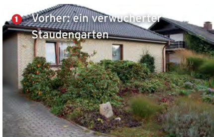
1 Vorher: ein verwucherter Staudengarten

In diesem Vorgarten ist alles streng aufeinander abgestimmt: Granitpalisaden umschließen rechteckige Hochbeete, die symmetrisch vor dem Wohnhaus angeordnet sind. Wie Würfel wirken die Eibenbüsche, die in einer Flucht stehen. Blickfang ist ein säulenförmiger Tulpenbaum. Das Grau der Beeteinfassungen aus Granit findet seine Korrespondenz im chinesischen Basalt, mit dem ein Gehweg an der Hauswand angelegt wurde, und in den anthrazit-farbenen Naturklinkern der Garagenauffahrt. Wird die Atmosphäre tagsüber von der beruhigenden Kühle der Steine bestimmt, so erwacht dieser Vorgarten bei Nacht zu erstaunlichem Leben: Alle Eiben werden von LED-Strahlern angeleuchtet und bieten ein stimmungsvolles Relief.