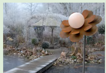
Ein Blickfang für den Garten von Familie Knut: Die MÄHLER-MOON-Blume

MÄHLER-MOON-Blumen mit Original Moonlight-Leuchtkugeln kann man auch kaufen. Sie sind in Edelstahl oder in Cortenstahl (Rostoptik) erhältlich. Informationen: www.galabau-maehler.de