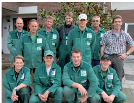
MÄHLER: Mitglied im Verband Garten- und Landschaftsbau Rheinland e.V.

Aber Sie kennen das: Manchmal reichen auch die stärksten Arme nicht aus, um sein Ziel zu erreichen. Da muss das passende Arbeitsgerät her. Kein Problem – wir haben einen professionellen Fuhrpark. Mit Maschinen für alle grünen Fälle: Von der Stubbenfräse über Motorsschubkarren bis zur Rasenschälmaschine. Superpower im Miniformat bietet unser Mikrobagger. Mit seiner Breite von nur 70 cm findet der seinen Weg selbst in den kleinsten Garten. Und mit unserer Hubarbeitsbühne erklettern wir die