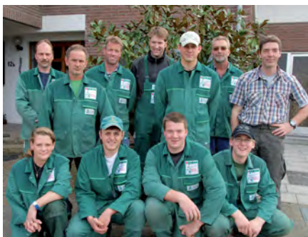
MÄHLER: Mitglied im Verband Garten- und Landschaftsbau Rheinland e.V.

Aber Sie kennen das: Manchmal reichen auch die stärksten Arme nicht aus, um sein Ziel zu erreichen. Da muss das passende Arbeitsgerät her. Kein Problem – wir haben einen professionellen Fuhrpark. Mit Maschinen für alle grünen Fälle: Von der Stubbenfräse über Motorsschubkarren bis zur Rasenschälmaschine. Superpower im Miniformat bietet unser Mikrobagger. Mit seiner Breite von nur 70 cm findet der seinen Weg selbst in den kleinsten Garten. Und mit unserer Hubarbeitsbühne erklettern wir die