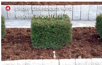
4 Jeder Eibenbusch wird einzeln angestrahlt.