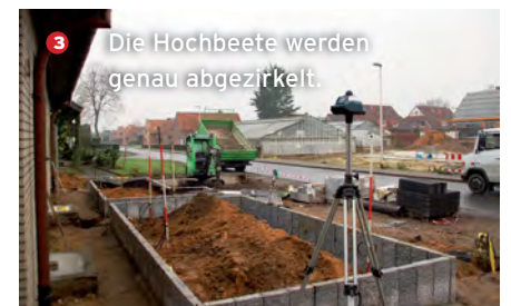
3 Die Hochbeete werden genau abgezurkt.