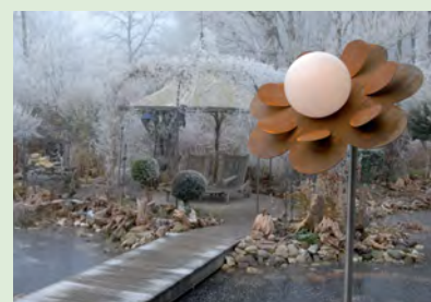
Ein Blickfang für den Garten von Familie Knut: Die MÄHLER-MOON-Blume

MÄHLER-MOON-Blumen mit Original Moonlight-Leuchtkugeln kann man auch kaufen. Sie sind in Edelstahl oder in Cortenstahl (Rostoptik) erhältlich. Informationen: www.galabau-maehler.de