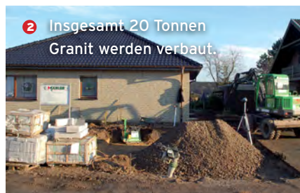
2 Insgesamt 20 Tonnen Granit werden verbaut.