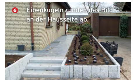
6 Eibenkugeln runden das Bild an der Hausseite ab.